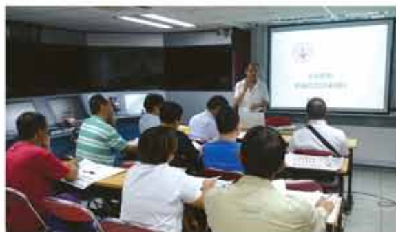
上圖是在本會進行的「本地船舶模擬駕駛訓練課程」。

今後我們將繼續努力，一如既往地做好維護海員權益工作，協調勞資關係，致力協助船員在職培訓，參與國際海員事務，為香港航運事業的發展貢獻一份力量。