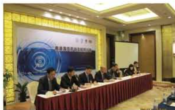
2013年於上海舉辦「香港海員勞動法規研討會」。